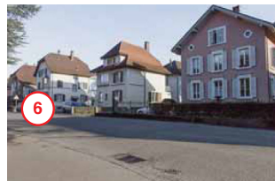
Gurnigelstrasse Gurnigelstrasse 42-52