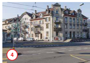
Aarbergstrasse Rue d'Aarberg 83-85