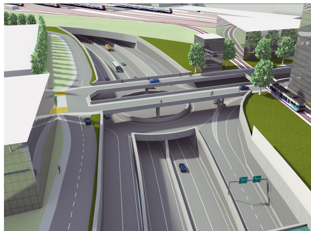
Autobahnanschluss Bahnhof (Visualisierung der A5-Planer) Junction Gare (visualisation des planificateurs de l'A5)