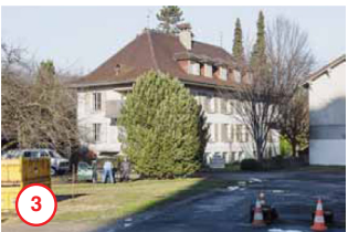
Unterer Quai Quai du Bas 30