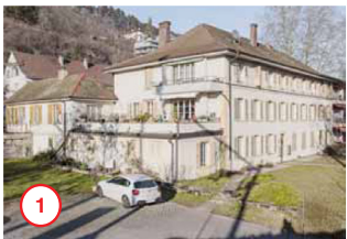
Seedorf Faubourg du Lac 5-7

Quelques unes des 71 maisons qui devront être démolies