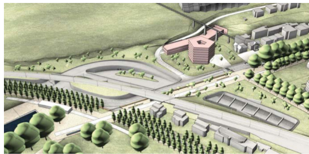
Autobahnanschluss Strandboden (Visualisierung der A5-Planer) Junction Prés-de-la-Rive (visualisation des planificateurs de l'A5)