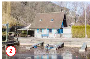
Neuenburgstrasse Route de Neuchâtel 8